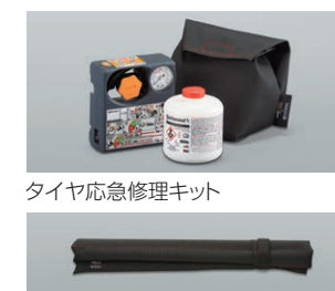
ベッドの脚収納(袋)

取り外した脚は専用袋に収納します。また、 タイヤ応急修理キットは専用袋に収 納されています(ラバレッドアクセント入 り)。