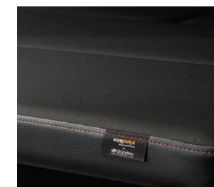
ベッドマット生地

シートに施された溶岩をイメージしたラバ レッドアクセントをベッドマットサイドに採用。 インテリアの統一感を生み出します。ベッド上 面はCORDURA®を採用。●CORDURA® はインビスタ社の登録商標です。