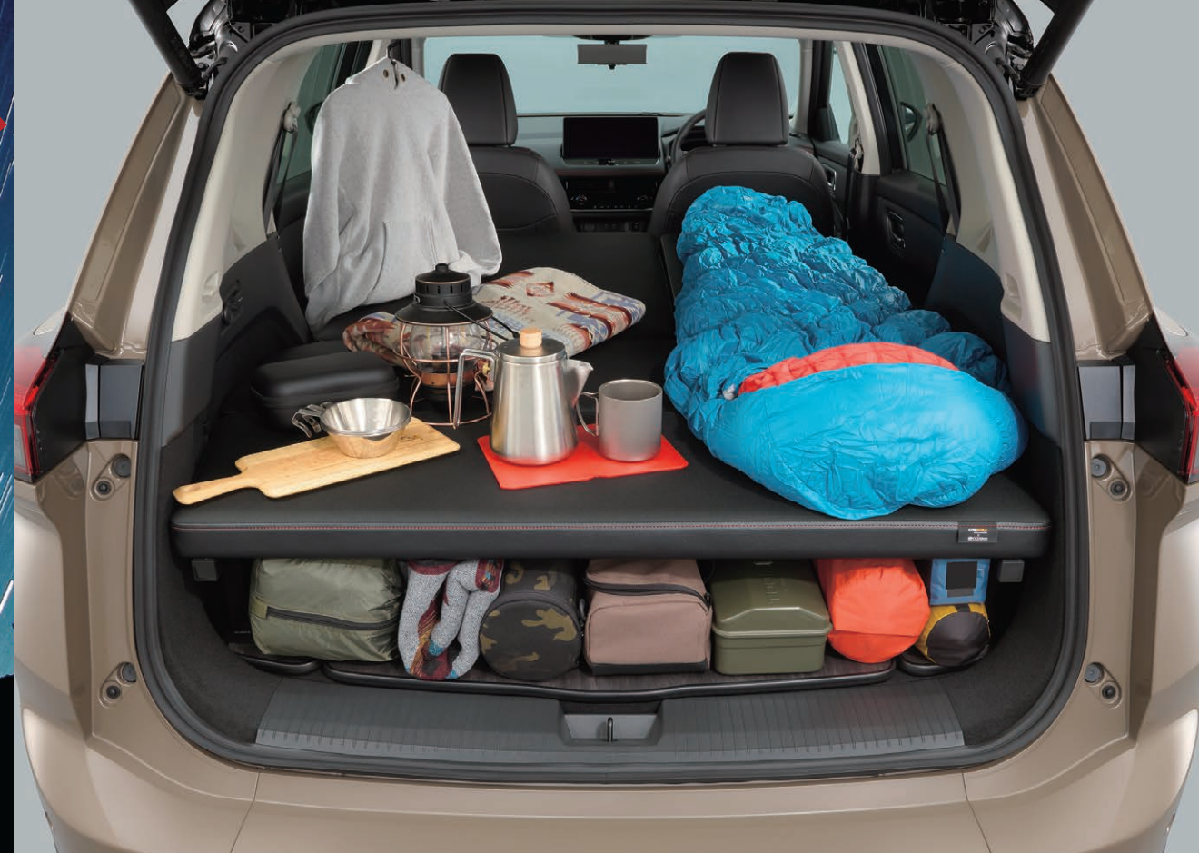
Photo: ROCK CREEK e-4ORCE マルチベッド。 ボディカラーはキャニオンベージュ/スーパーブラック 2トーン(※XKVスクラッチシールド) (特別塗装色)、 【ROCK CREEK専用色】、内装色はブラック(G)、オプション装着車。 ※写真の小物は撮影のための小道具となりますので、標準装備には含まれません。