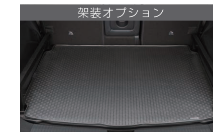
専用ラゲッジラバーマット

取り外した脚は専用袋に収納します。また、 タイヤ応急修理キットは専用袋に収 納されています(ラバレッドアクセント入 り)。