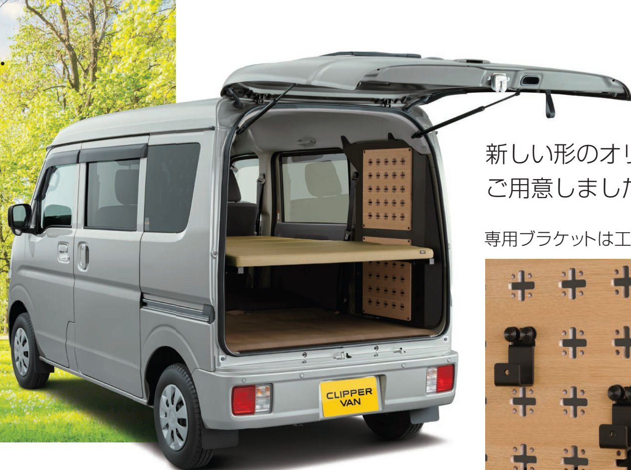
Photo:GX(4WD)マルチラック(ナチュラルベージュ)ベッドマット付車。 ボディカラーはモスグレー(#WBW)。内装色はブラック(G)。

ラックが叶える、遊ぶ・泊まる・働くの理想のカーライフ。 クリッパーバン「マルチラック」。