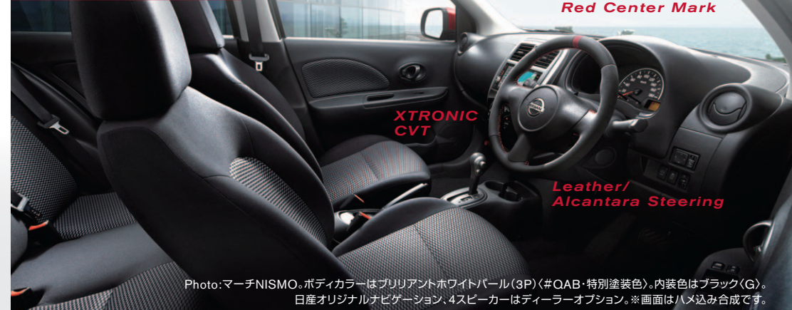
Red Center Mark