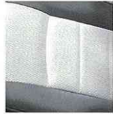
ウォームグレー(W) (パンチングネオスウェード/ネオスウェードコンビ)

※エアロパーツ装着のため縁石や段差の大きな場所や不整地路等では路面などと干渉する場合がございます。あらかじめご承知おきください。 ※本車両は持ち込み登録でオートテック扱いとなります。