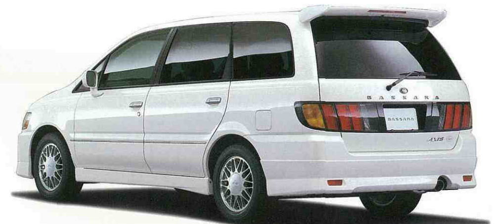
PHOTO：アクシス(2WD 2400ガソリン)。ボディカラーはホワイトパール(3P) (#QT1・特別塗装色)。 ※専用ルーフスポイラーはオーテック扱いオプション。