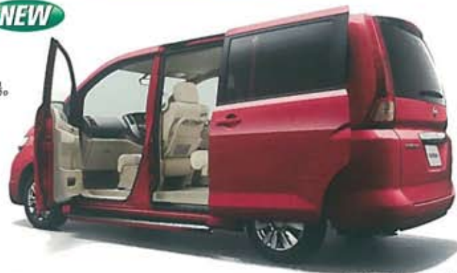
Photo:アンシャンテ スタイリッシュステップ 20S(2WD)。ボディカラーはローズレッド(P)(#A33)。内装色はサンドベージュ(P)。カーウイングスナビゲーションシステム(地デジ内蔵・HDD方式)+CD一体AM/FM電子チューナーラジオ+ステアリングスイッチ+バックビューモニター、リモコンオートスライドドア(両側、挟み込み防止機構付)+インテリジェントキー+エンジンイモビライザー、撥水加工シート(ファインペロア)はメーカーオプション。ロンググリップ、ステップイルミネーションはオーテック扱いオプション。ボディカラーはベース車の設定色から、お好きなものをお選びいただけます。

スタイリッシュステップ/スタイリッシュステップ ロンググリップ付車 共に上記グレードに設定がごさいます。