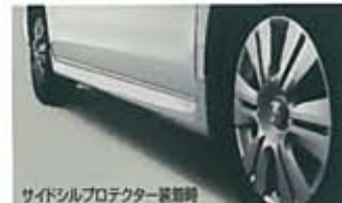
サイドシルプロテクター装着時