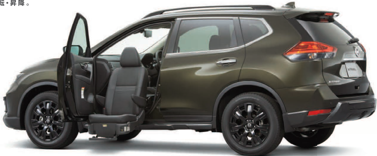
Photo: 20X エクストリーマーX 助手席スライドアップシート(4WD・2列シート車) 【特別塗装】。ボディカラーはチタニウムカーキ(PM)(#EAN:スクラッチシールド)(特別塗装色)。内装色はブラック(G)。オプション装着車。 ※エクストリーマーXへの装着も特別塗装にて承ることができます。詳しくは販売会社にお問い合わせください。

寸法(20X 助手席スライドアップシート) 各寸法はメーカー設計値であり、参考値です。