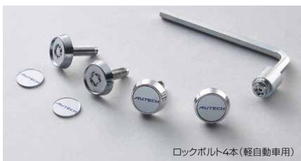
ロックボルト4本 (軽自動車用)