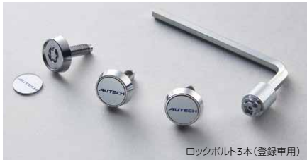
ロックボルト3本 (登録車用)