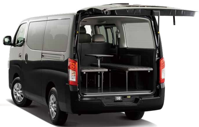
Photo:バンGRAND プレミアムGX マルチベッド(2WD)。ロングボディ 標準幅 標準ルーフ 低床5人乗り5ドア。 ボディカラーは、ミッドナイトブラック(P) (#GAT:スクラッチシールド) (特別塗装色)。 内装色はブラック(G)。塗装専用オプション(脱着式テーブルく高さ調整機能付)装着車。