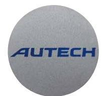
AUTECHロゴステッカー付