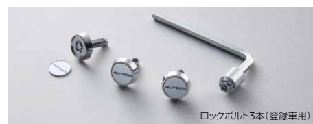
ロックボルト3本(登録車用)