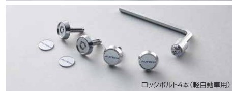
ロックボルト4本(軽自動車用)