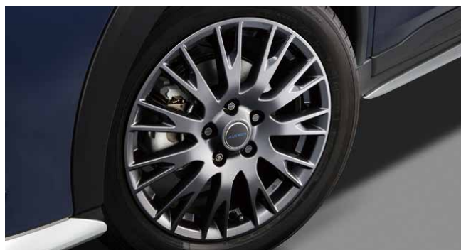
※03.エアバルブキャップ、04.セキュリティホイールロック、05.センターキャップエンブレム装着例

頭部にAUTECHロゴを埋め込んだセキュリティ ホイールロック。大切なアルミホイールを盗難 から守るマックガード社製。