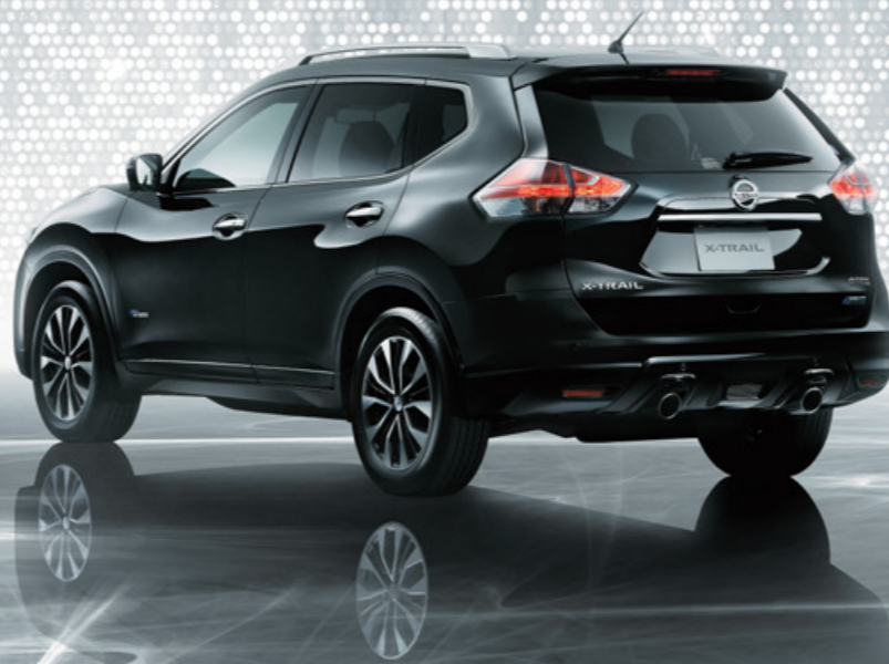
Photo：モード・プレミアHYBRID（オーテック30周年特別仕様車）（4WD）。 ボディカラーはダイヤモンドブラック（P）（※G41・スクラッチシールド）（特別塗装色）。内装色はブラック（C）。 ルーフレール、NissanConnect ナビゲーションシステム＋ステアリングスイッチ（オーディオ、ナビ、ハンズフリーフォン、クルーズコントロール）＋アラウンドビューモニター（MOD〔移動物検知〕機能付）＋インテリジェントパーキングアシスト＋BSW（後側方車両検知警報）＋ふらつき警報＋クルーズコントロールはメーカーオプション。