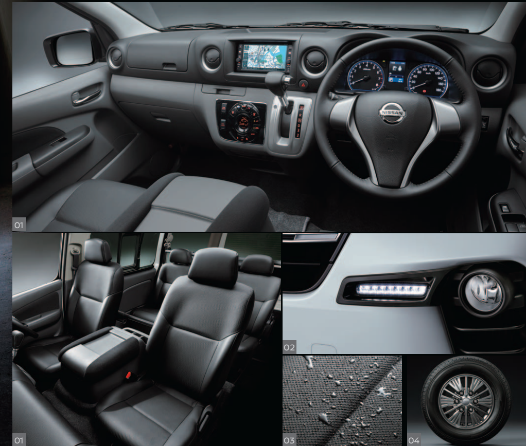
Photo: ライダー プロ・スタイル パッケージ バン プレミアムGX(2WD・ガソリン)。内装色はダークグレー(W)。 インテリジェント アラウンドビューモニター+ディスプレイ付自動防眩式ルームミラー+ヒーター付ドアミラー+フロントアンダーミラーレス+ リアアンダーミラーレスはセットでメーカーオプション。日産オリジナルナビゲーションはディーラーオプション。*画面はハメ込み合成です。