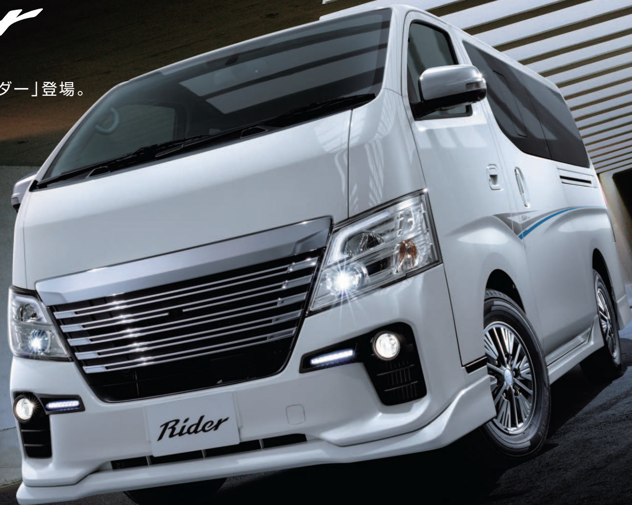
Photo: ライダー プロ・スタイル パッケージ バン プレミアムGX(2WD・ガソリン)。 ロングボディ 標準幅 標準ルーフ 低床 5人乗 5ドア。 ボディカラーはブリリアントホワイトパール(3P)(#QAB)(特別塗装色)。 インテリジェント アラウンドビューモニター+ディスプレイ付自動防眩式ルームミラー+ヒーター付ドアミラー+ フロントアンダーミラーレス+リアアンダーミラーレスはセットでメーカーオプション。 専用サイドシルプロテクター&専用リヤアンダープロテクター、専用ルーフスポイラーはオーテック扱いオプション。 専用ボディサイドデカールはオーテック扱いディーラーオプション。