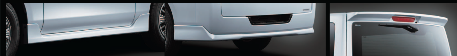
専用サイドシルプロテクター&専用リヤアンダープロテクター