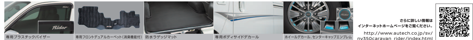
専用プラスチックパイザー | 専用フロントデュアルカーペット(消臭機能付) | 防水ラグマット | 専用ボディサイドデカール | ホイールデカール、センターキャブエンブレム

お問い合わせご相談内容につきましては、お客様ご対応や品質向上のために記録活用させていただきます。また、販売会社等からご返信させていただきますことをご通知と判断した内容は必要な範囲で情報を開示し、当該販売会社様からお客様にご連絡をさせていただきます場合もございますので、あらかじめご了承ください。なお、株式会社オーテックジャパンにおける個人情報の取り扱いに関する詳細は、右記「オーテックジャパンホームページ」に掲載しております。