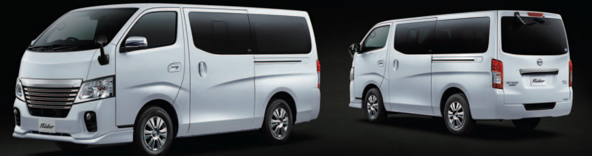
Photo: ライダー バン プレミアムGX(2WD・ガソリン)。 ロングボディ 標準幅 標準ルーフ 低床 5人乗 5ドア。 ボディカラーはブリリアントホワイトパール(3P)(#QAB)(特別塗装色)。

*1 メーカーオプションのインテリジェント アラウンドビューモニター装着車(リアアンダーミラーレス車)のみ取付可能です。 ●セルクロスはスミノエティンテクノ株式会社、カブロン、パートナーはアキレス株式会社の登録商標です。