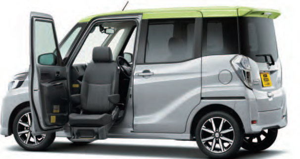
Photo:ハイウェイスター-X Gパッケージ 助手席スライドアップシート。ボディカラーはエアグレイ(PM)/レモンライム2トーン(＃FMY) (特別塗装色)。内装色はエボニー(G)。

リモコンひとつで簡単操作。 シートが電動で回転・昇降します。 車いすをお使いの方でも楽に乗り降りできます。