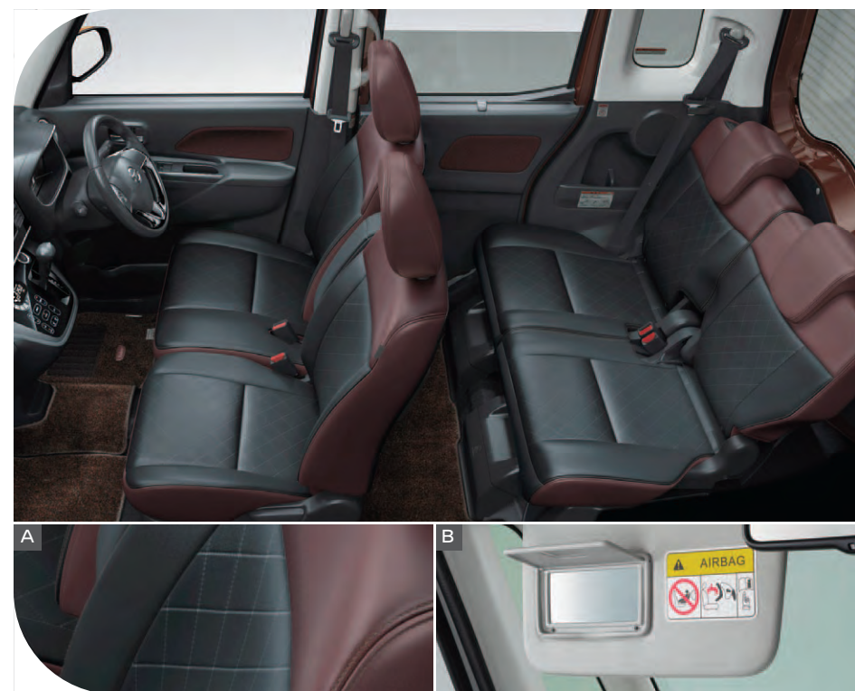
シックなコンビネーションカラーがポイントのレザー調シート。 ヒーター付だから寒い日でも快適なドライブが楽しめます。