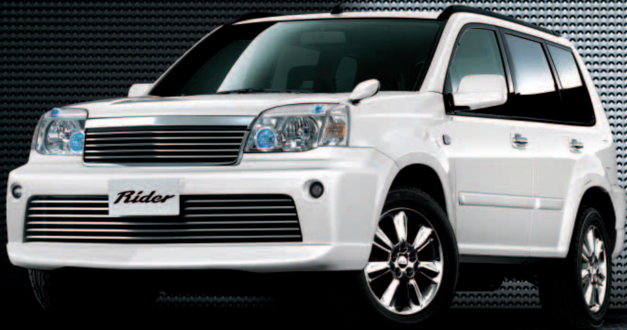
Photo:ライダーステージ2(4WD)。ボディカラーはホワイトパール(3P)〈#QX1・特別塗装色〉。*「ライダー」はエアロパーツ装着のため、緑石や段差の大きな場所や不整地路等では路面などと干渉する場合があります。あらかじめご承知おきください。