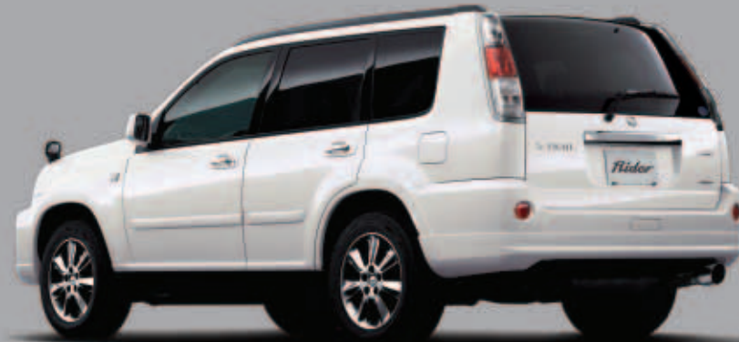
*「ライダー」はエアロパーツ装着のため、緑石や段差の大きな場所や不整地路等では路面などと干渉する場合があります。あらかじめご承知おきください。

2WD (E-ATx) 2,488,500円 (消費税抜き価格) 2,370,000円 4WD (E-ATx) 2,677,500円 (消費税抜き価格) 2,550,000円