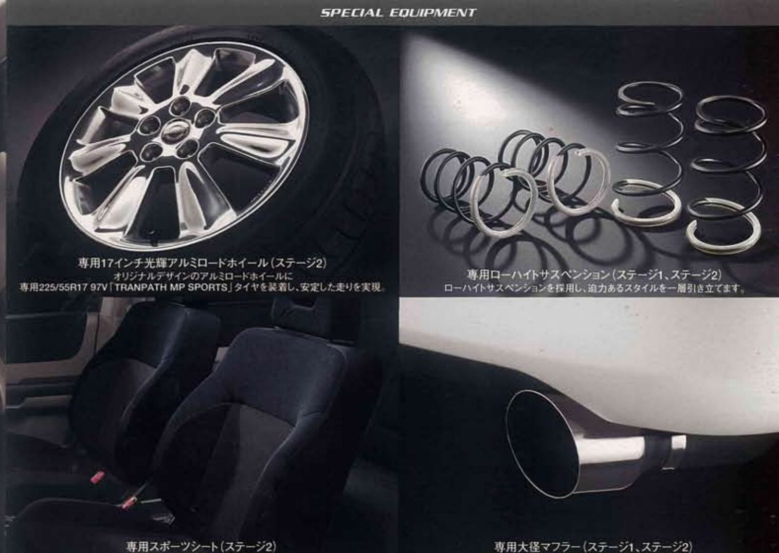
専用17インチ光輝アルミロードホイール(ステージ2) オリジナルデザインのアルミロードホイールに 専用225/55R17 97V「TRANPATH MP SPORTS」タイヤを装着し、安定した走りを実現