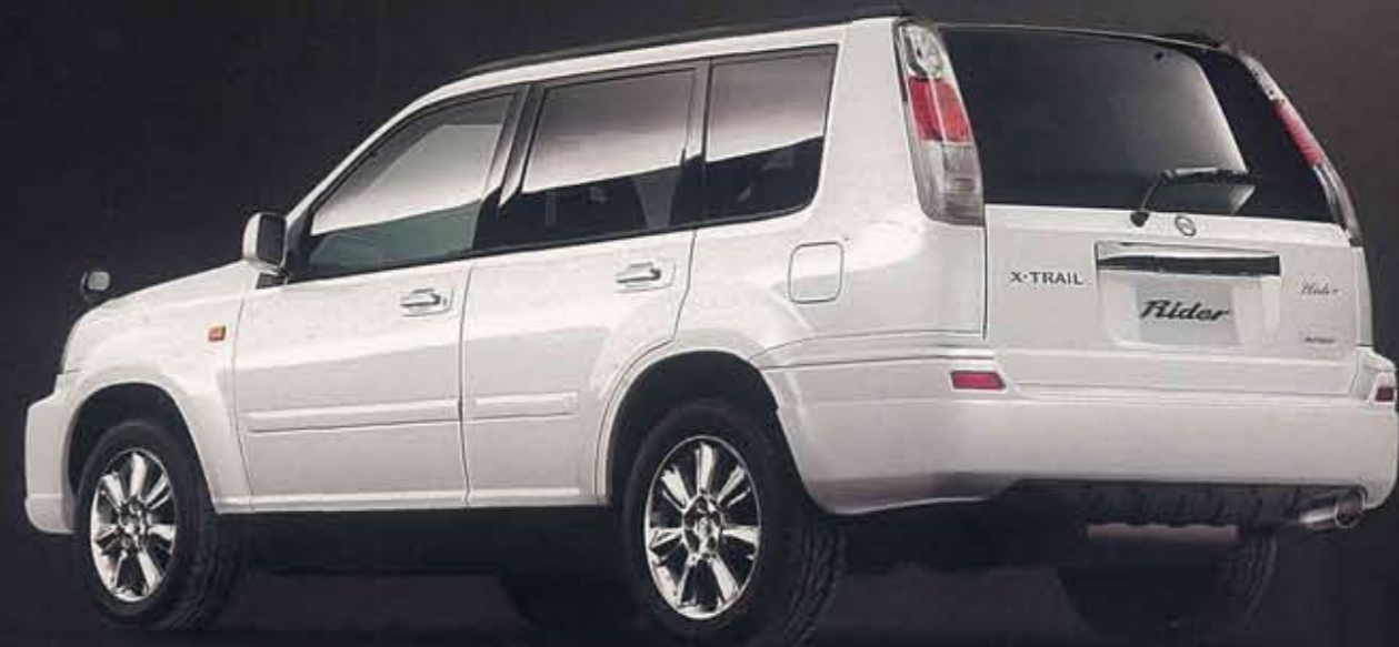
Photo:ライダー ステージ2(4WD)。ボディカラーはホワイトパール(3P)(≠WK0)(特別塗装色)。プライバシーガラスはメーカーオプション。 ※「ライダー」はエアロパーツ装着のため、緑石や段差の大きな場所や不整地路等では路面などと干渉する場合があります。あらかじめご承知ください。