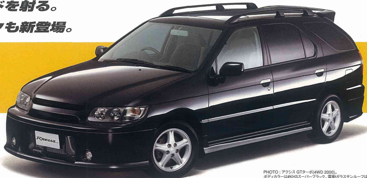
PHOTO: アクシス GTターボ(4WD 2000). ボディカラーは#KH3スーパーブラック。電動ガラスサンルーフはメーカーオプション。 専用ルーフスポイラーはオートテックジャパン扱いオプション。