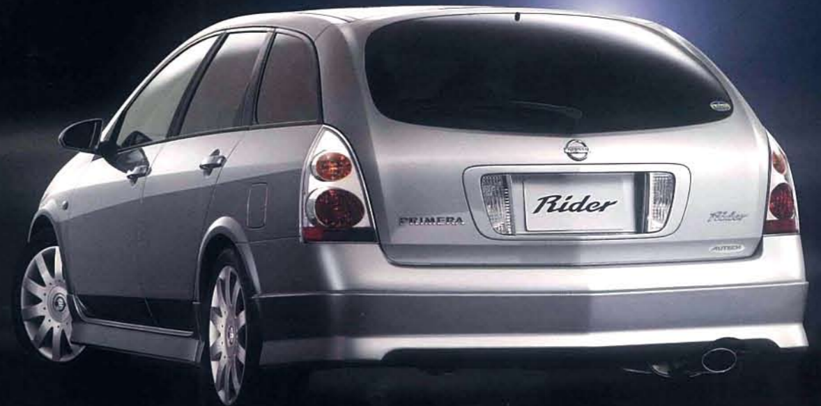
Photo:ライダー。ボディカラーはダイヤモンドシルバー(M)<=KY0>。ライダーはエアロパーツ装着のため、縁石や段差の大きな場所や不整地路等では路面などと干渉する場合があります。あらかじめご承知ください。