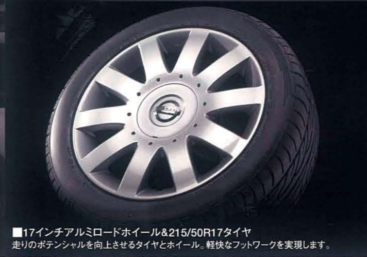
■17インチアルミロードホイール&215/50R17タイヤ 走りのポテンシャルを向上させるタイヤとホイール。軽快なフットワークを実現します。