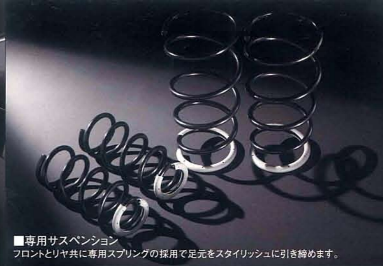
■専用サスペンション フロントとリヤ共に専用スプリングの採用で足元をスタイリッシュに引き締めます。