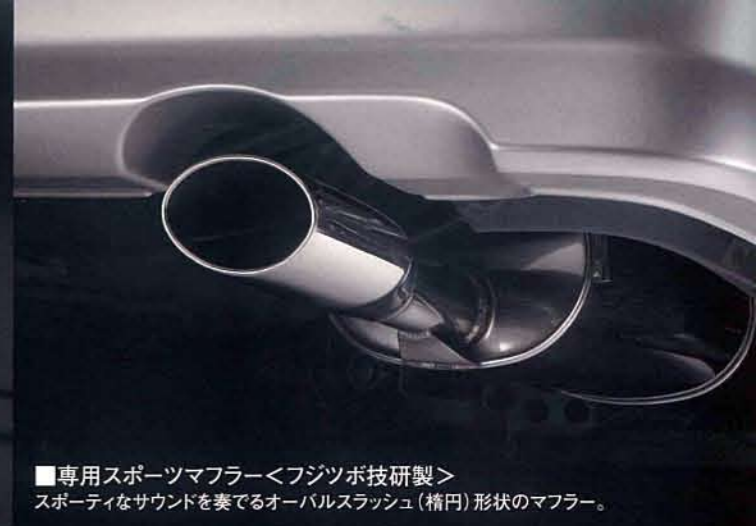
■専用スポーツマフラー<フジツボ技研製> スポーティなサウンドを奏でるオーバルスラッシュ(精円)形状のマフラー。