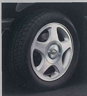
◆205/50R15 85Vラジアルタイヤ(ダンロップPERFORMA8000) & 15インチアルミロードホイール(15×6JJ)