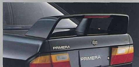
◆圧倒的な存在感をもたらす大型リアスポイラー