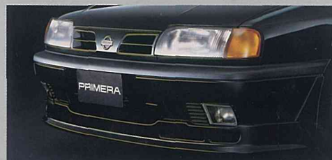
◆専用フロントグリルとブレーキ冷却ダクト付フロントスポイラー

高性能ツインカムエンジンSR20DEをベースとし、専用エキゾーストマニホールド/フロントチューブ及び専用コントロールユニットを採用。さらに圧縮比アップやバルブタイミングの変更などにより、180PS/6800rpmと30PSアップを実現。どの回転域からでもパワフルでシャープな加速を提供。