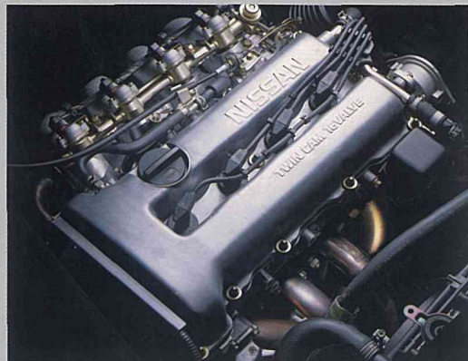
SR20DEチューンドエンジン性能曲線

1993cc, DOHC Max. Power : 180PS/6800rpm Max. Torque : 19.6kgm/5600rpm