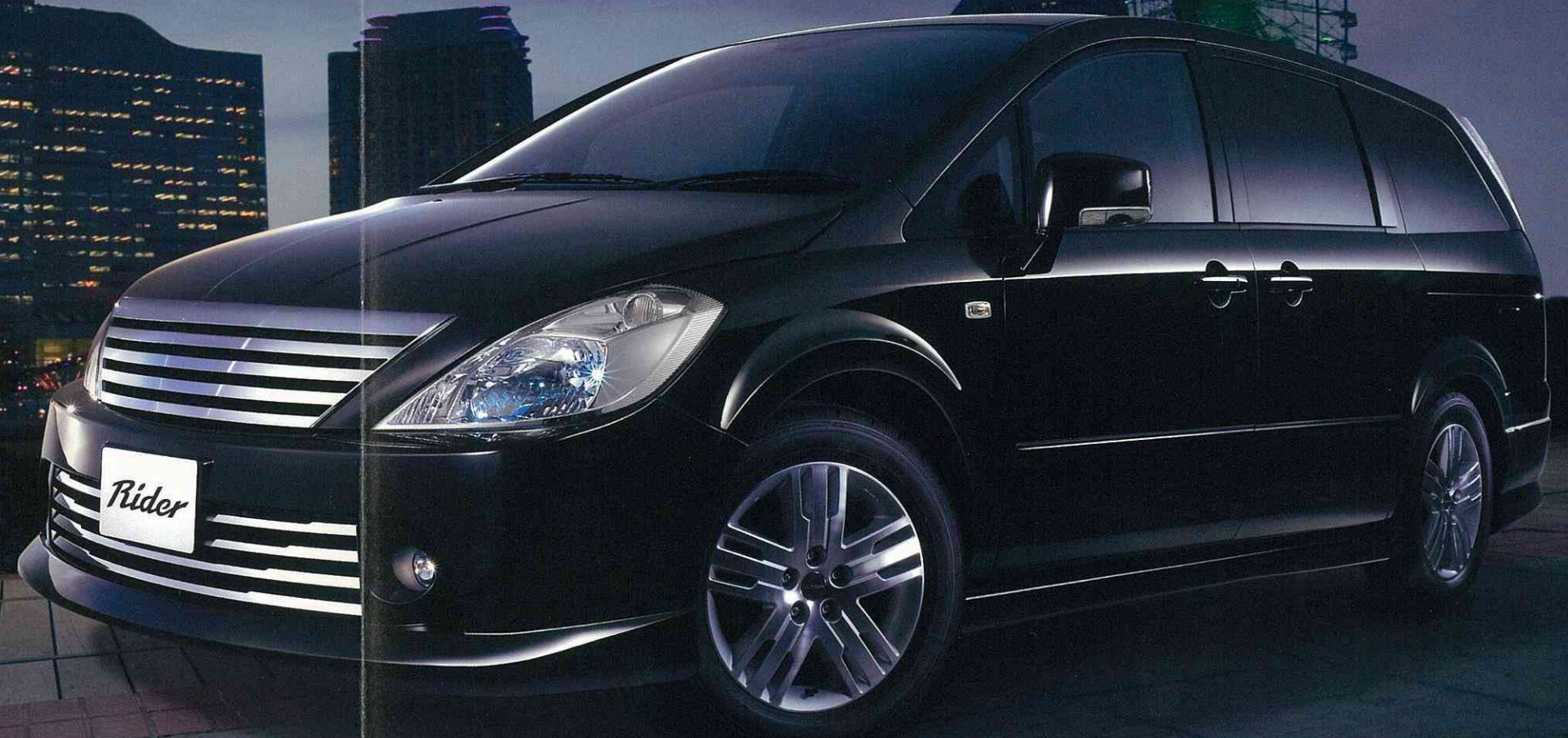
Photo:「ライダーアルファ」(2WD)。ボディカラーはサファイアブラック(P)〈#B20〉。カーウイングスナビゲーションシステム(DVD方式)+ステアリングスイッチ、バックビューモニター、サイドブラインドモニター、リモコンオートスライドドアはメーカーオプション。