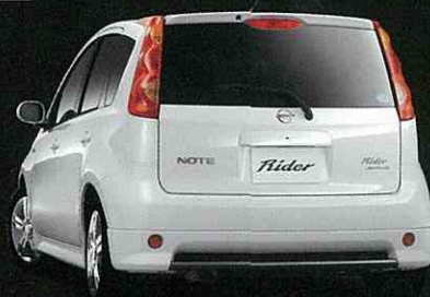
Photo:ライダーアルファII。 ボディカラーはホワイトパール(3P)〈#OX1・特別塗装色〉。 内装色はブラック(G)、オプション装着車。