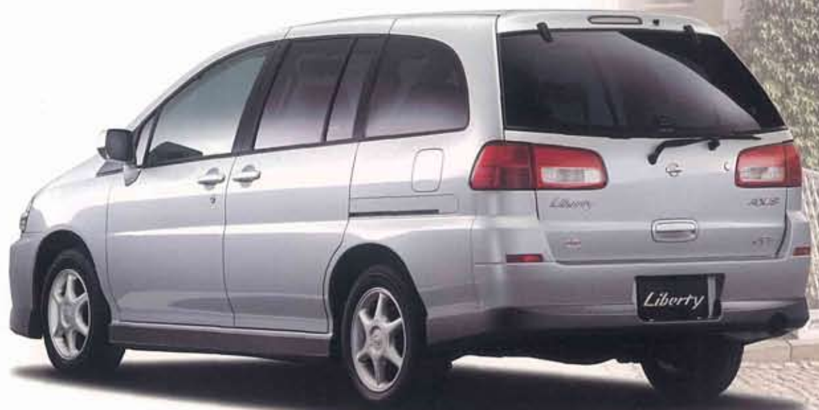
Photo: アクシス(2WD)。ボディカラーはプラチナシルバー(M)(#KL0)。 15インチアルミロードホイール、プライバシーガラス、スライドドアオートクローザーはメーカーオプション。