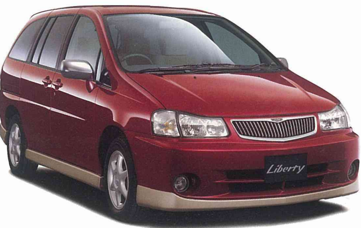
Photo: アクシス(2WD)。ボディカラーはレッドパール(#AT4)。15インチアルミロードホイール、プライバシーガラス、スライドドアオートクローザーはメーカーオプション。

#QT1 ホワイトパール(3P) #KL0 プラチナシルバー(M) #AT4 レッドパール (3P)は3コートパール、(M)はメタリックの略です。