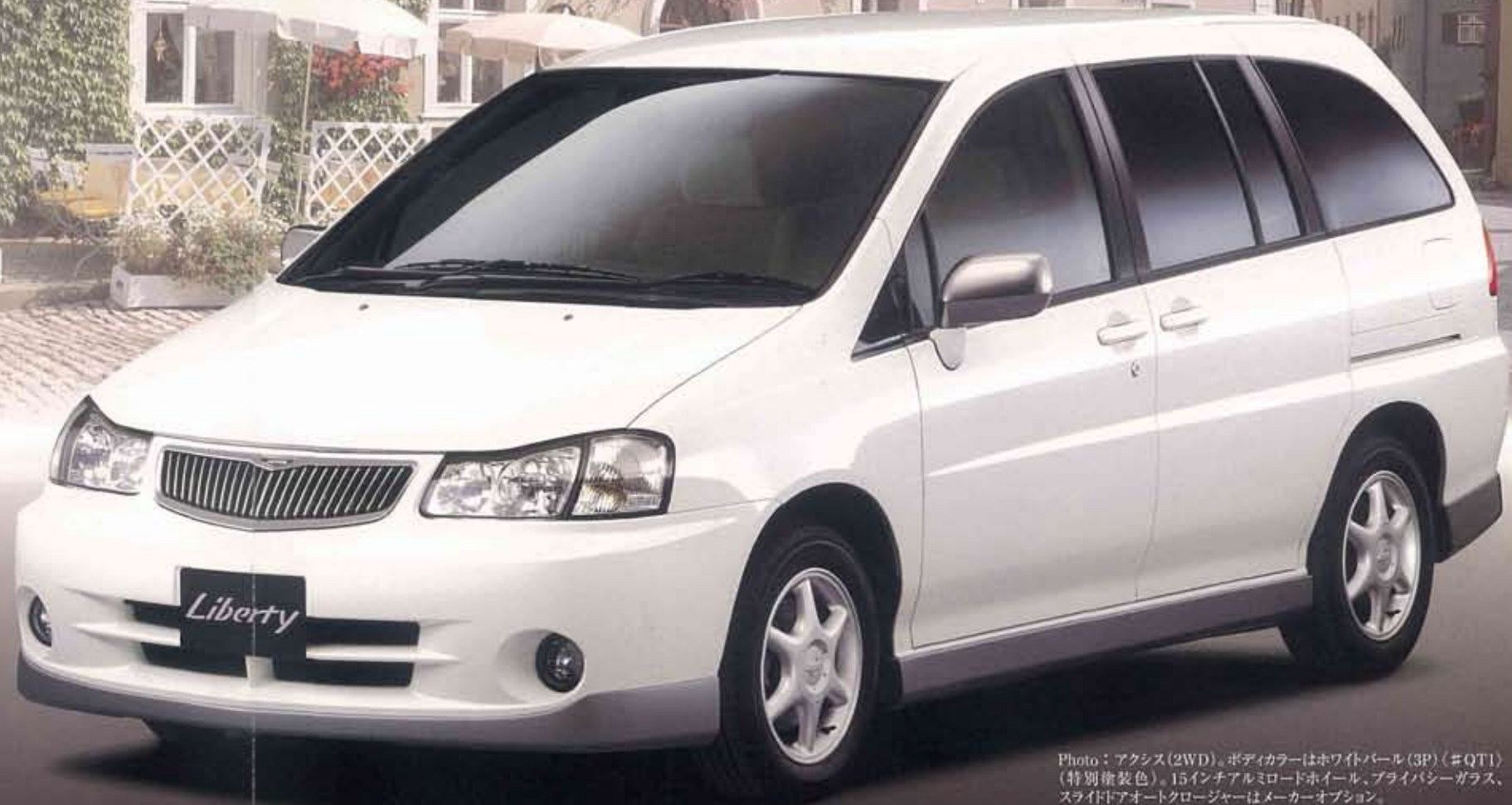
Photo: アクシス(2WD)。ボディカラーはホワイトパール(3P)(#QT1) (特別塗装色)。15インチアルミロードホイール、プライバシーガラス、スライドドアオートクローザーはメーカーオプション。