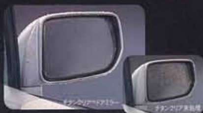
●専用チタンクリア™ドアミラー(メッキ) 外観の美観に加え、鏡面に親水性の高いチタン膜をコーティング。鏡面に付着した水滴を弾き飛ばして、後方を見やすくします。