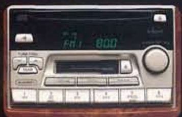
●専用CD・カセット一体 AM/FM電子チューナーラジオ(Panasonic製)