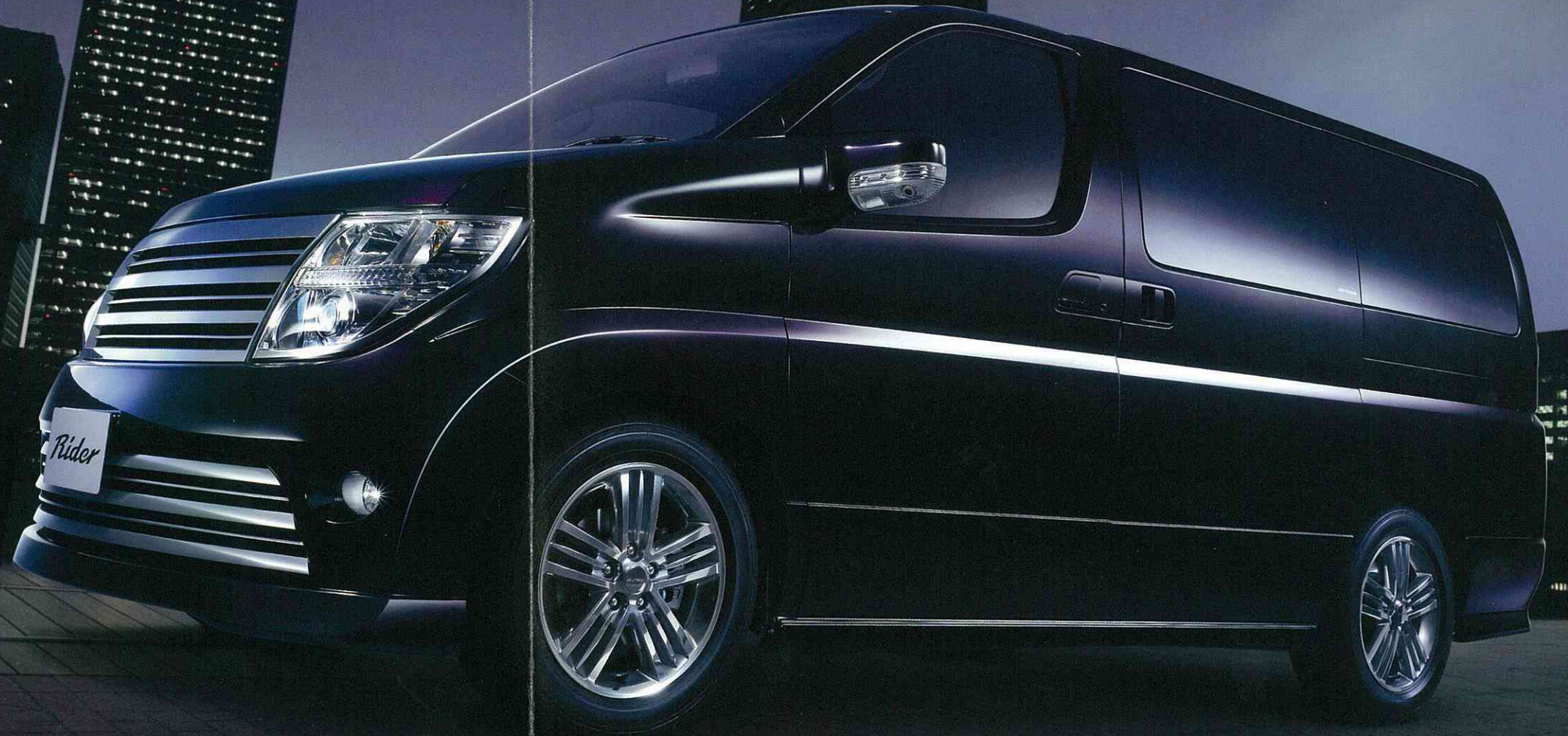
Photo:「ライダーアルファ」(2WD)。ボディカラーはミスティックブラック(3RP) (#G30) (特別塗装色)。カーウイングスナビゲーションシステム (DVD方式) & ツインモニターシステム+ステアリングスイッチ+バックビューモニター+サイドブラインドモニターはメーカーオプション。