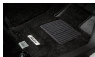
専用フロアカーパー (消臭機能、ライダーエンブレム付)