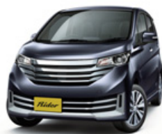
プレミアムパープル(P) <#VYN-特別塗装色>