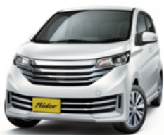
ホワイトパール(3P) <#SLN-特別塗装色>