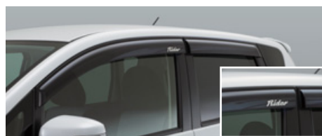
専用プラスチックバイザー (ストライプ、ライダーエンブレム付)