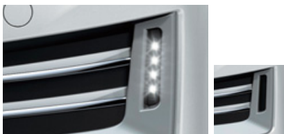
専用LEDデイトタイムランニングライト 非装着時