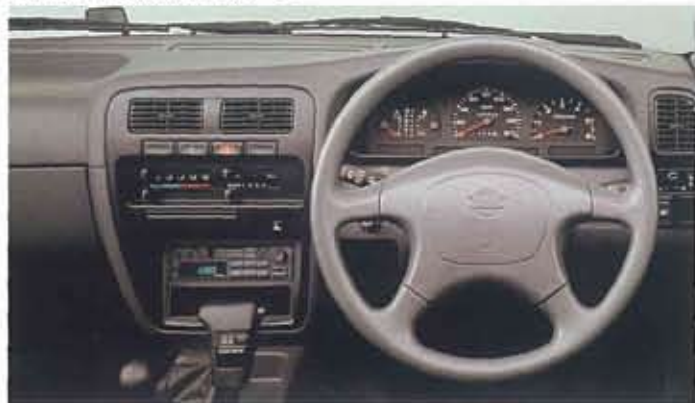
■ワイルド アダックス DRパッケージ