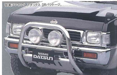
写真はワイルド アダックス DRパッケージ。 専用ステンレス製フロントガードバー&フォグランプ(IPF製・スーパーラリー) & フロントアンダーガード (フォグランプとアンダーガードはワイルド アダックスには装着されません)