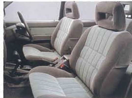
写真はワイルド アダックス。 寒冷地仕様、ヒーター付シートはメーカーオプション。 内装色はグレー(O)