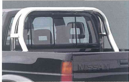
専用ステンレス製ロールオーバー写真はワイルド アダックス DRパッケージ。 ワイルド アダックス DRパッケージに標準装備 (ワイルド アダックスにオーテックジャパン扱いオプション)