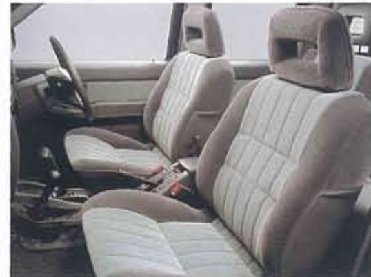
写真はワイルド アダックス DRパッケージ。 寒冷地仕様、ヒーター付シートはメーカーオプション。 内装色はグレー(K)