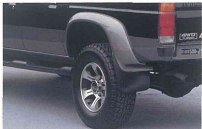
大型フェンダー(リヤ) 写真はワイルド アダックス DRパッケージ。