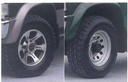
15x7JJアルミロードホイール (ワイルド アダックス DRパッケージ) 15x7JJスチールロードホイール (ワイルド アダックス)