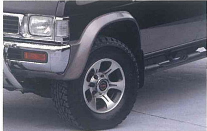
大型フェンダー(フロント) 写真はワイルド アダックス DRパッケージ。