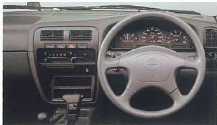
■ワイルド アダックス

写真はワイルド アダックス。 ボディカラーはダークグリーンパール(2P) (≠DJ2)。