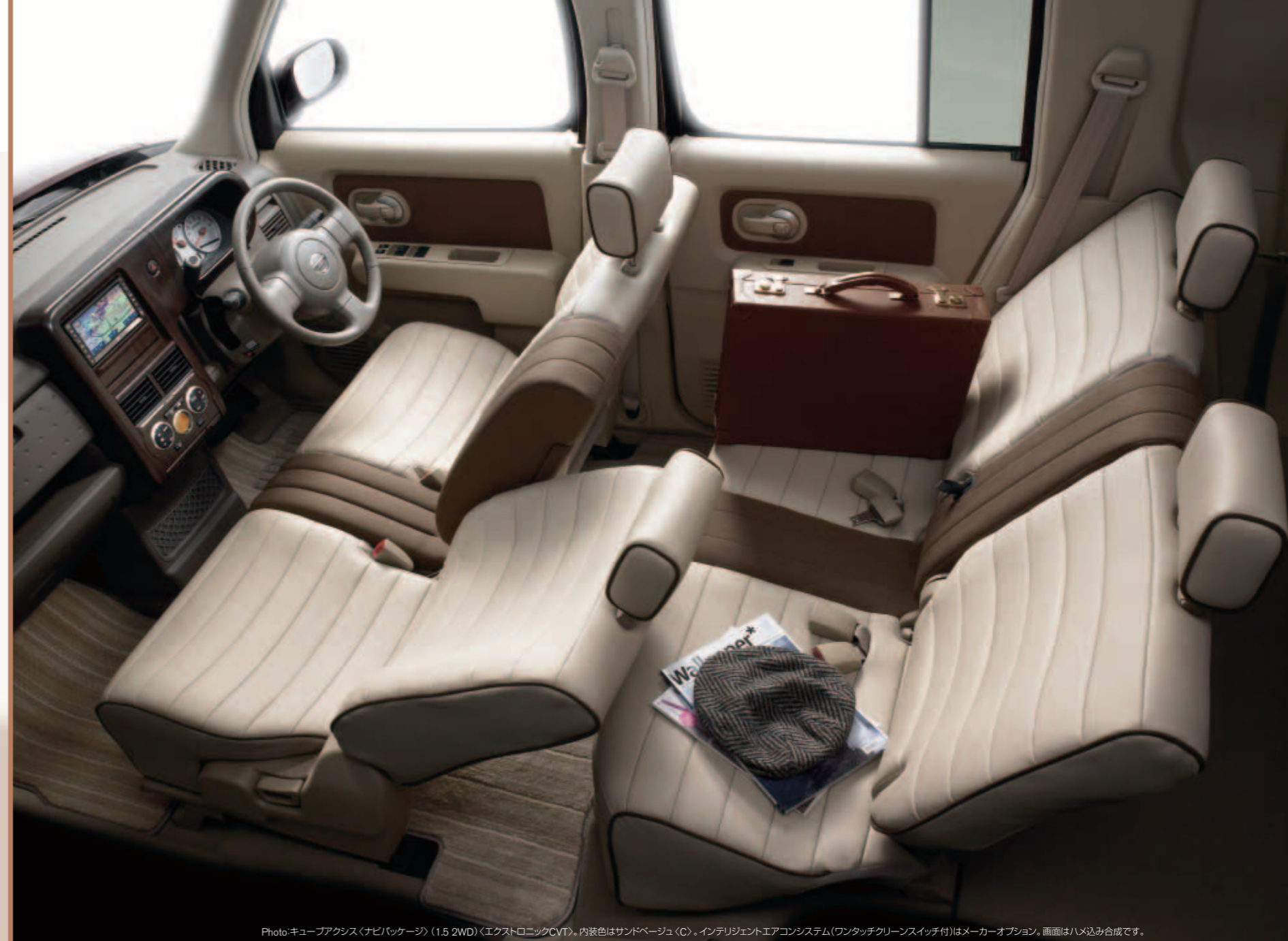
Photo:キューブアクシス(ナビパッケージ)(1.5 2WD)〈エクストロニックCVT〉。内装色はサンドベージュ(C)。インテリジェントエアコンシステム(ワンタッチクリーンスイッチ付)はメーカーオプション。画面はハメ込み合致です。