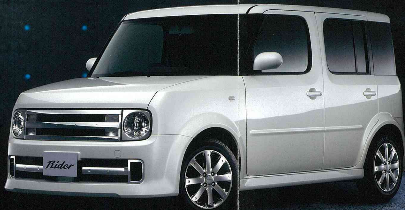
Photo:キューブ「ライダーアルファII」。ボディカラーはホワイトパール(3P)〈#QX1・特別塗装色〉。内装色はグラフアイト(K)。オプション装着車。