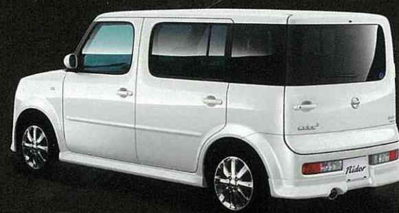
Photo:キューブキュービック「ライダーアルファII」。ボディカラーはホワイトパール(3P)〈#QX1・特別塗装色〉。内装色はグラフアイト(K)。オプション装着車。

「特別」にこだわり、個性を極めたライダーが、さらにスタイリッシュに。 スポーティテイストが際立つもうひとつの個性、 特別限定車「ライダーアルファII」新登場。 プレミアム感に満ちたその装いは、ときめく心と響きあう。