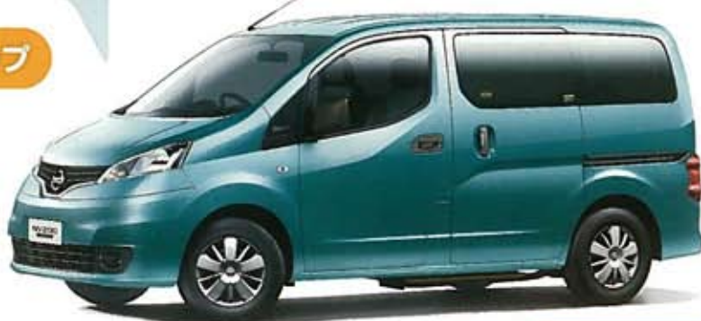
PHOTO: NV200バネット チェアキャブ 車いす1名仕様 3人掛けリヤシートタイプ(2WD) ボディカラーはブルーイッシュグリーン(M)(#FAD)。 内装色はブラック/グレー(W)。

手動式のアルミ製2段引き出し式スロープです。すばやく引き出せ、スムーズに乗り降りすることができます。(耐荷重:200Kg)